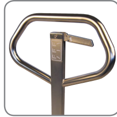
Die ergonomische Deichsel gewährt dem Anwender einen entspannten Griff.

Die Geräte entsprechen der Gerätegruppe II und sind für Bereiche zugelassen, die als Zone 1/Zone 21 klassifiziert sind (umfassen auch Zone 2/Zone 22). Das heißt Bereiche, in denen zu rechnen ist, dass eine gefährliche, explosionsfähige Atmosphäre durch ein Gemisch aus Gasen oder durch Staub gelegentlich auftritt.