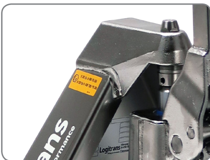
Die ex-geschützten Geräte sind für die Pharmaindustrie, sowie die Farben-, Öl- und Gasindustrie gut geeignet.

II 2G Ex h IIB T6 Gb II 2D EX h IIB T85°C Db