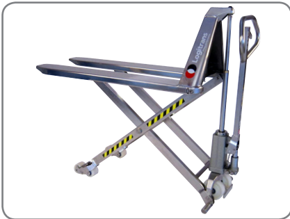
Die Standard-Geräte sind manuell und aus rostfreiem Stahl hergestellt.

Die explosionsgefährdete Ausführung ist mit der folgenden Produktkennzeichnung versehen: