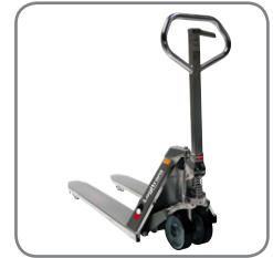
Die robuste Konstruktion garantiert eine lange Lebensdauer und niedrige Wartungskosten.