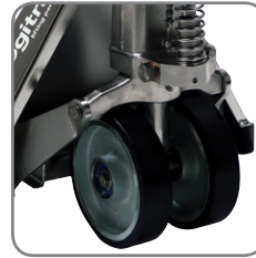
Die Geräte haben zwei anti-statische Vulkollan-Räder, um elektrostatische Aufladung zu vermeiden